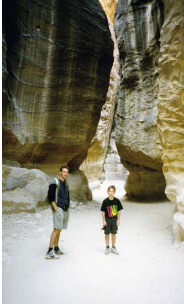
På veg inn mot byen Petra

–Vi har tre underverker her i Midtøsten, sa den gamle mannen i Eilat. – Det er Pyramidene, Jerusalem og Petra. Et par dager seinere satt jeg og min unge nevø i en taxi på veg fra Eilats naboby Akaba til Petra.