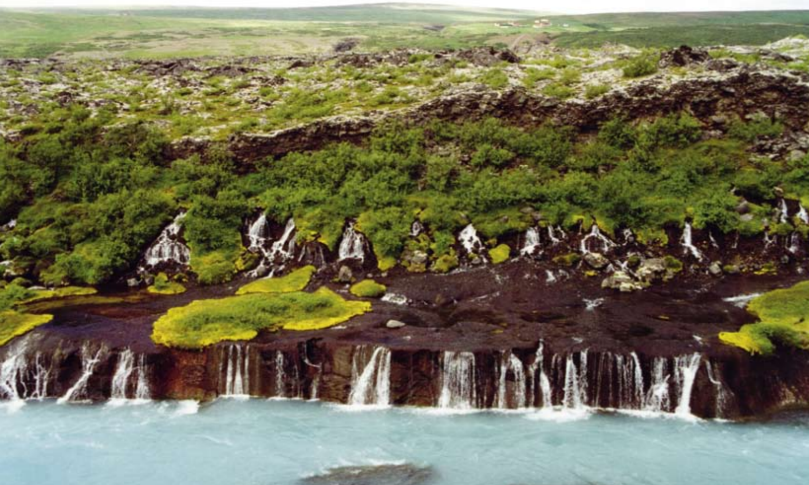
Hraunfossar (Lavafossen) ved Húsafell er så absolutt spesiell

medisinsk umulighet, men det tenkte nok ikke han på. Dessverre kom han i land ved lavafeltet, slik at det var som å gå barbeint på glasskår da han tok seg fram til bebyggelsen. Ei jente fra øyene, som jeg traff i Hveragerdi, sa at den største forskjellen på Norge og Island er at folk i Norge i større grad går rundt og hoster og synes synd på seg selv. Det er mulig at vi må skjerpe oss.